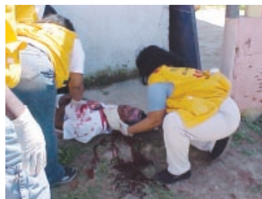
Vítima simulada é socorrida por voluntários.

A participação de mais de dois mil moradores de Jardim Ana Clara, o Corpo de Bombeiros e o Grupamento Aéreo-Marítimo da Polícia Militar, foi exemplo perfeito da colaboração mútua entre empresas privadas, Comunidade e Poder Público, comemorando mais um Simulado APELL de sucesso.