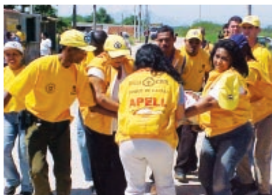
Voluntários atuando no Simulado APELL/2002.